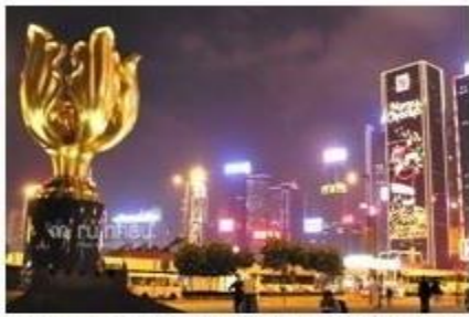
TRUNG TÂM DƯƠNG TỬ KINH

Kết thúc chương trình. Chia tay đoàn và hẹn gặp lại Quý khách.