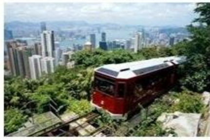
XE ĐIỆN CỎ ĐIỆN