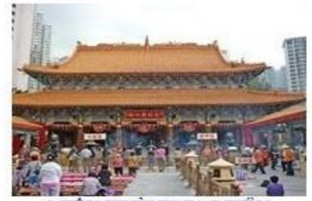
MIÊU HUỖNH ĐẠI TIỀN