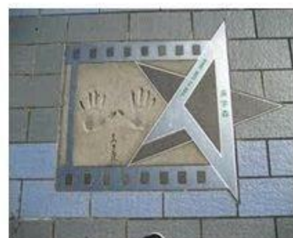
ĐẠI LỘ NGÔI SAO