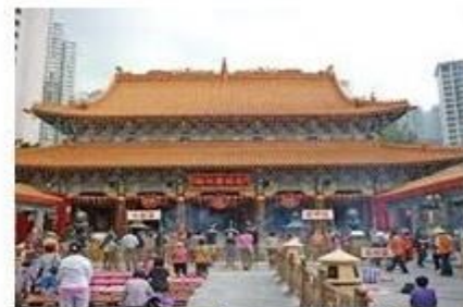
MIẾU HUỠNH ĐẠI TIÊN