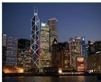
VỊNH NƯỚC CẠN