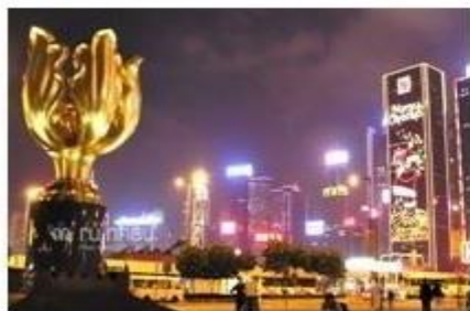
TRUNG TÂM DƯƠNG TỬ KINH