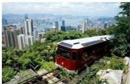
XE ĐIỆN CỎ ĐIỆN